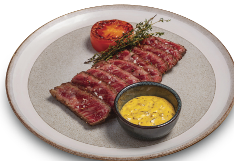
Bistec de ternera Wagyu

SOLOMILLO DE TERNERA DE IRLANDA 36.00 250gr. Elija una guarnición y una salsa (SG)